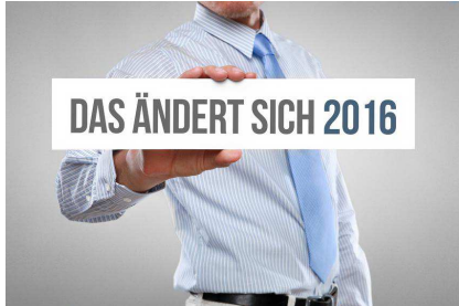
Fotolia: Das ändert sich 2016@Coloures-pic

Die Bundesregierung hat nach der Entwurfsvorlage Ende Mai 2016 am 17. August 2016 eine Artikelverordnung zur Änderung der BetrSichV und weiterer Arbeitsschutzverordnungen beschlossen.