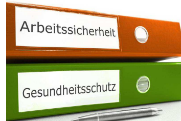
Arbeitssicherheit und Gesundheitsschutz

In diesen Regelwerken wird Arbeits- und Gesundheitsschutz als ein dynamischer Prozess verstanden, der auf die technischen und